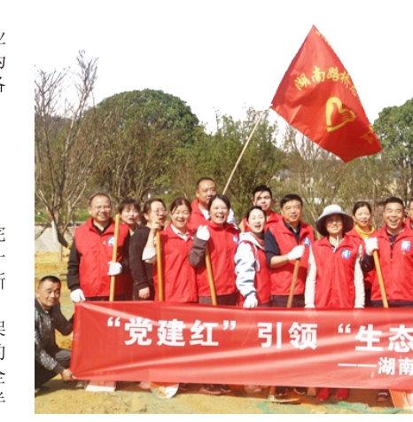
“党建红”引领“生态绿” 绘就美丽乡村新画卷 ——湖南路桥三分公司党委“学雷锋”志愿服务

2022年9月7日，官新三标C匝道桥60米曲线小半径梁板顺利架设完成，这是省内高速公路首次成功进行60米曲线小半径梁板架设，为我省高速公路小半径曲线桥架